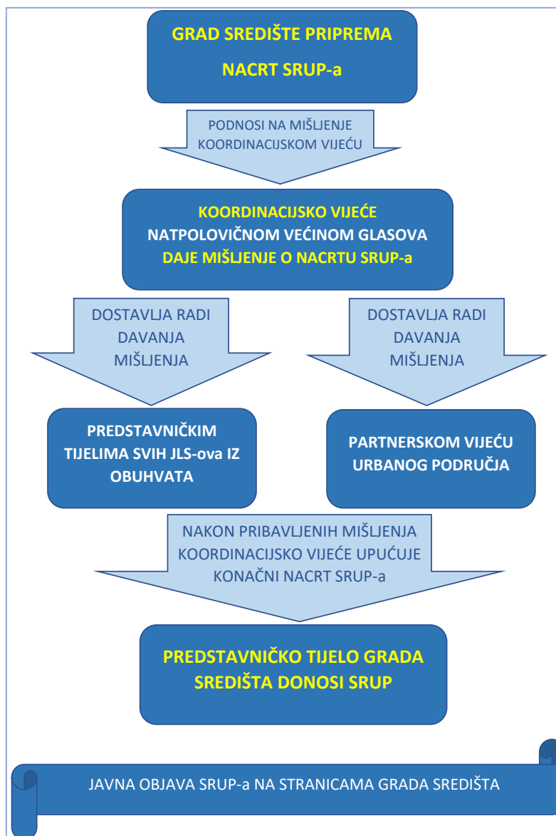
Slika 1: Shematski prikaz postupka izrade/izmjene/donošenja SRUP-a