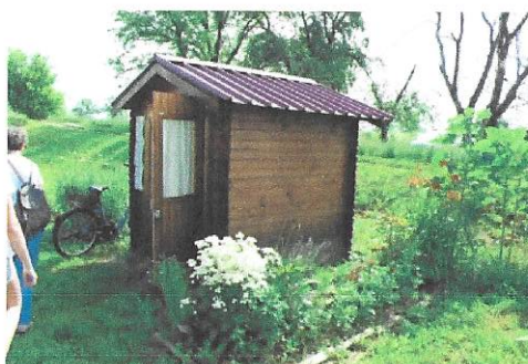
kućica za alat