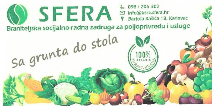
Primjeri promo letka