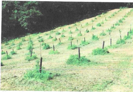
Hornet d.o.o., sadnja jabuka