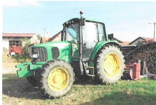
OPG Sačerić Matija (traktor)