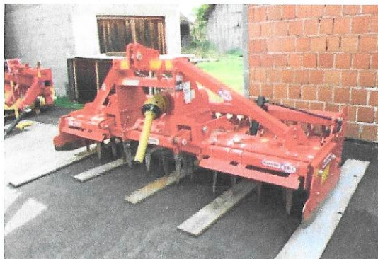
OPG Skolan Željko (rotodrljača)