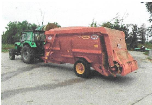
OPG Blažič Ružica (miksprikolica)