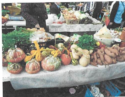
Prodajna mjesta na tržnici