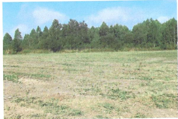
OPG Račić Hrvoje, uređenje zapuštenog poljopr. zemljišta