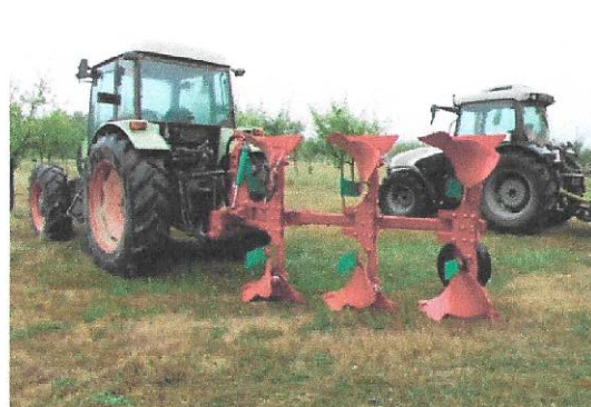
OPG Slonka Mihael (plug)